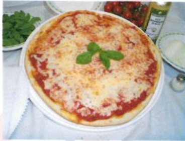
Formato: diam: 33 cm. Peso gr. 400 c.a.