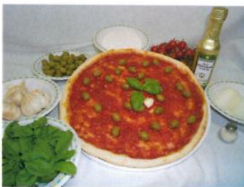
Pomodoro (polpa e succo 25%)

Farina di grano tenero 00, Acqua, Lievito di birra, Olio extravergine di oliva, malto, sale