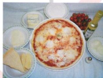
Pomodoro (25%) Mozzarella (20%) Stracchino (12%) Gorgonzola (10%) Formaggio grattugiato (8%)