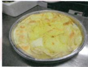
Formato: diam: 21 cm. Peso gr. 220 c.a.