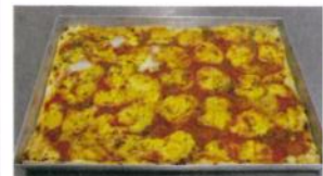
Formato: cm. 20 x 30 Peso gr. 350 c.a.