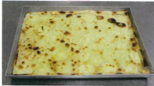
Formato: cm. 30 x 40 Peso gr. 700 c.a.