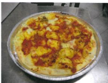
Formato: diam: 33 cm. Peso gr. 500 c.a.