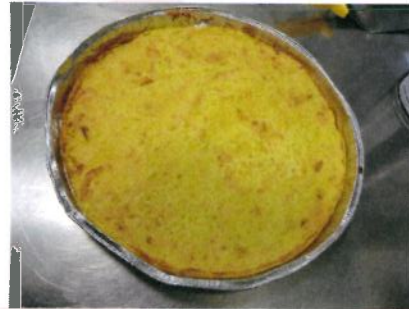
Formato: diam: 21 cm. Peso gr. 160 c.a.