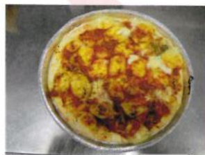
Formato: diam: 21 cm. Peso gr. 220 c.a.