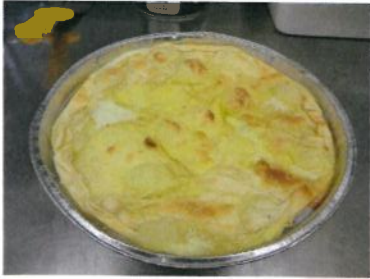
Formato: diam: 33 cm. Peso gr. 450 c.a.