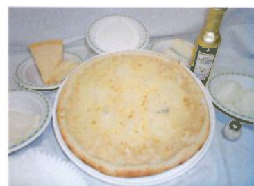
Mozzarella (20%) Stracchino (12%) Gorgonzola (10%) Formaggio grattugiato (8%)

Packaging: Cartone 25 pezzi 35x35x35 Pallet 24 cartoni 600 pezzi