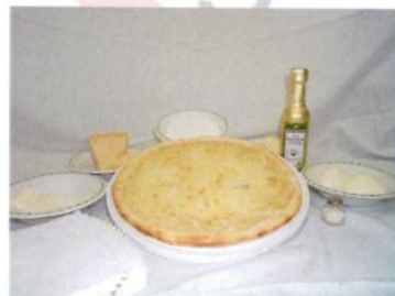
Stracchino (15%) Latte (15%) Mozzarella (8%)