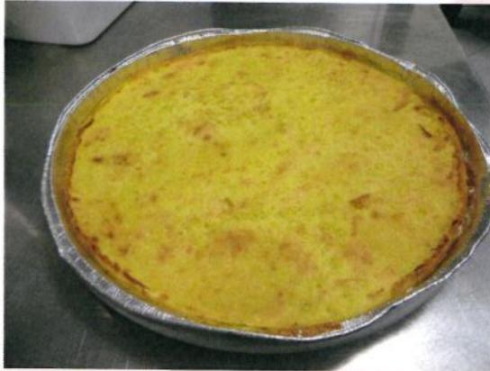
Formato: diam: 33 cm. Peso gr. 400 c.a.