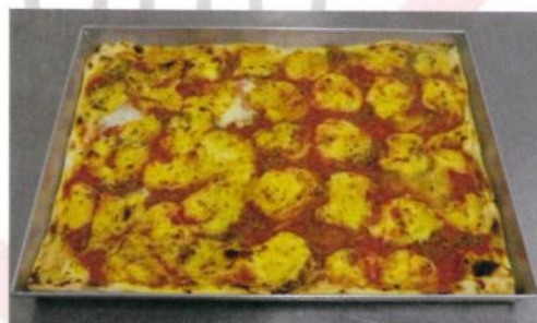
Formato: cm. 30 x 40 Peso gr. 750 c.a.