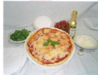
Formato: diam. 25 cm. Peso gr. 220 c.a.